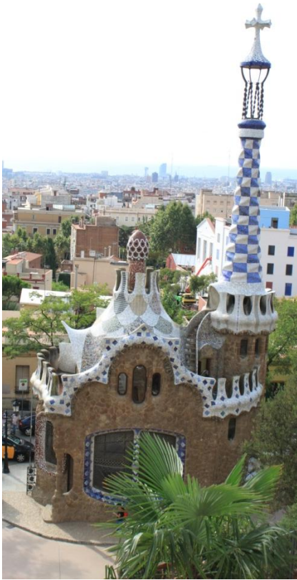
Ilustración 1: Casa de visitas del Park Güell al lado de la casa del portero. Ahora es la tienda de recuerdos.

Uno de los principales capitostes de la industria catalana y noble, fue don Eusebio Güell, quien contactó con Gaudí e hizo construir la Colonia Güell, el Park Güell y el Palacio Güell, entre otras obras, promoviendo así la cultura catalana que llevaba casi dos siglos de declive.